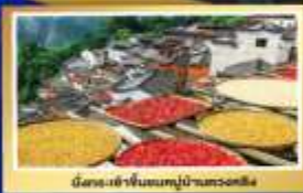
นิคมหมู่บ้านชนบทโบราณหวงหลิง