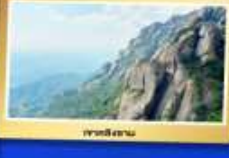
เขาตงผานาน