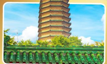
วัดพระเจี๋ยวแกว

เมนูพิเศษ เปิดปักกิ่ง, ชาหมูหม้อไฟ อาหารกวางตุ้ง, อาหารเสฉวน