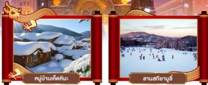
หมู่บ้านหิมะหิมะ