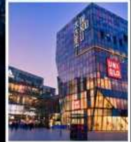
ย่านซานหลี่ถุน