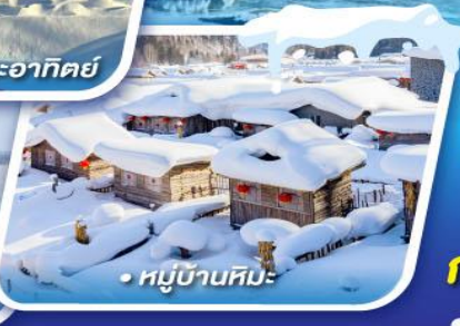
หมู่บ้านหิมะ