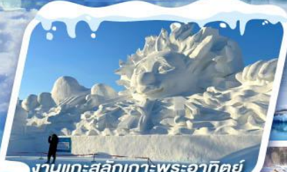
งานแกะสลักเทวพระอาทิตย์