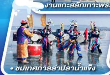
ชมเทศกาลสาปน้ำแข็ง