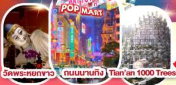
วัดพระหยกขาว ถนนนานกิง Tian'an 1000 Trees