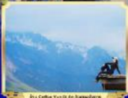
ทะเลสาบหยวนโถว