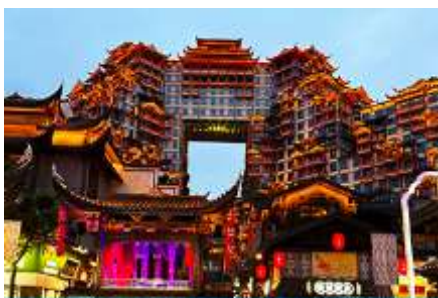
ตึกภัตตาคาร 72 ชั้น

พักที่ CHANGDE YUNXI HOTEL ระดับ 4 ดาวท้องถิ่น หรือเทียบเท่าในเมืองฉางเต๋อ