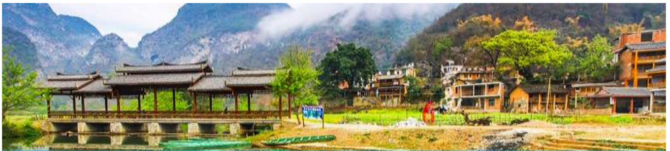
สวนดอกท้อ