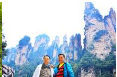
ชมจุดชมวิวลีฟก้าแก้ว