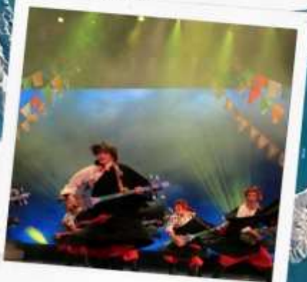
โชว์ทิเบต