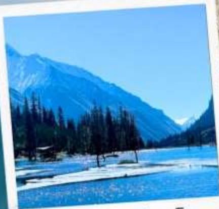
อุทยานชวงเจียวโกว