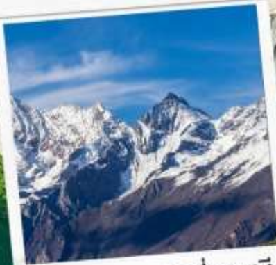
อุทยานภูเขาสี่ดรุณี