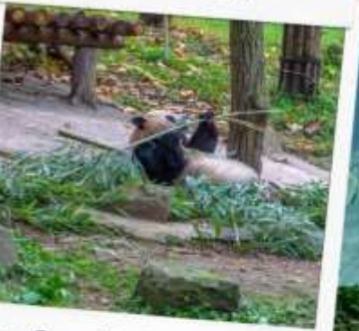
ศูนย์อนุรักษ์หมีแพนด้า