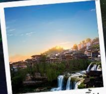
เมืองฟูหลงเจิน