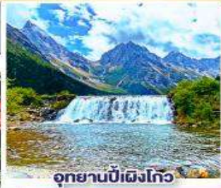
อุทยานปี่ฝงโกว