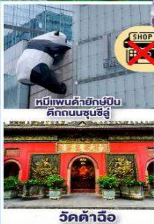
หมีแพนคั่ายัักขั้บััน คัักคณบชุนชัีลู่