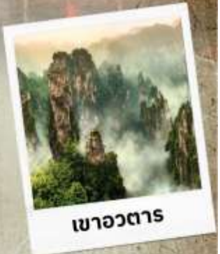
เขาวงตาร