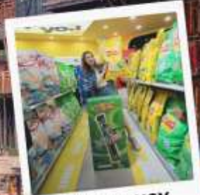
SNACK BUSY STATION