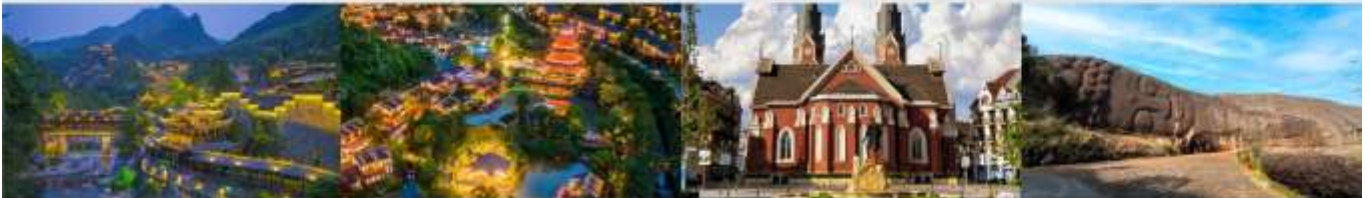
หวุ่นเขาเทวดาวังเซียนกู่