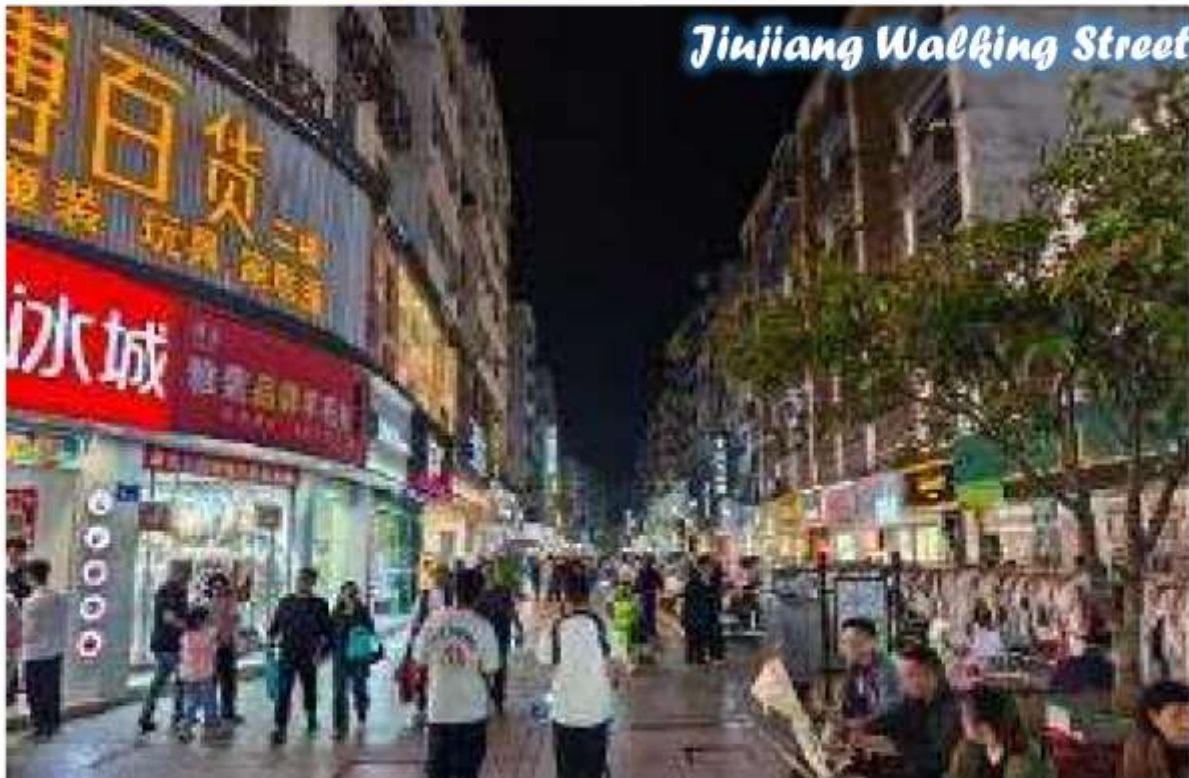
Jiujiang Walking Street