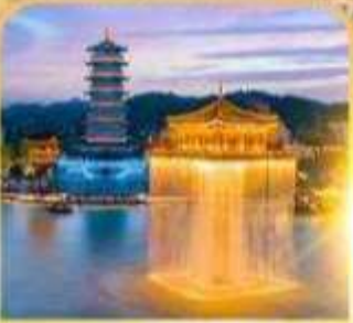
แสงสีอุ๋หนิวโจว