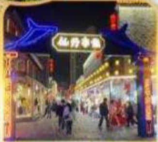
ถนนคนเดินวันโช่วกง