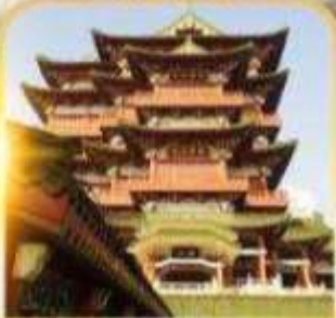
หอถึงหวังเก๋อ