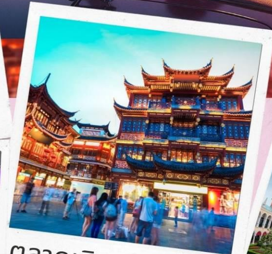
ตลาดเจิ้งหวังเมี่ยว