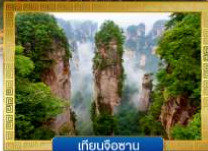
เทียนจื่อชาน