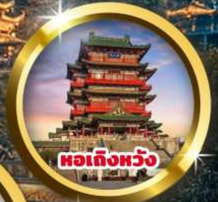
หอเกิ่งหวัง