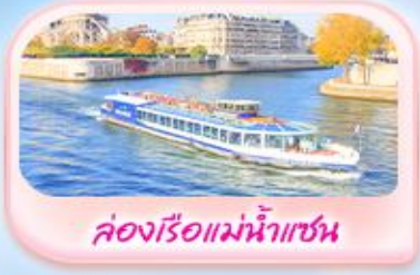
คลองเรือแม่น้ำเซน