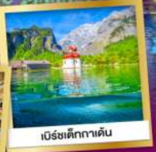
เบิร์ชติทกาเดิน