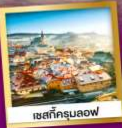
เซสท์ครุมลอฟ