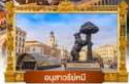
อนุสาวรีย์หนี

เมนู พิเศษ! จิวเวลีแอม + ทุบกับอับเลื่องชื่อ