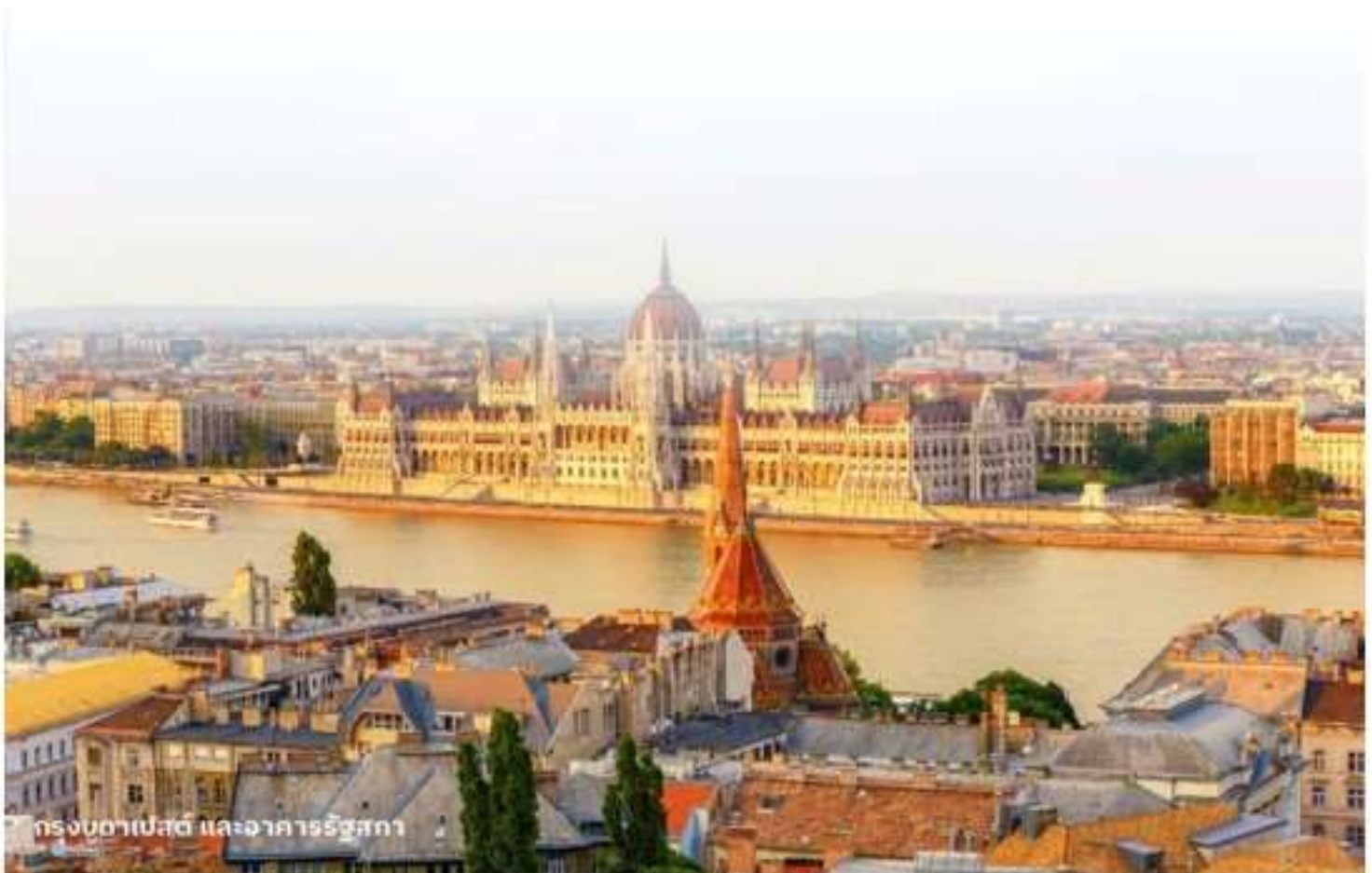
กรุงบูดาเปสต์ และอาคารรัฐสภา

นำท่านเข้าสู่ที่พัก Park Inn By Radisson Budapest หรือเทียบเท่า