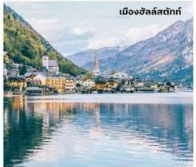
เมืองฮัลล์สตัดท์

บริการอาหารเช้า ณ ห้องอาหารของโรงแรม นำท่านเดินทางสู่ ฮัลล์สตัดท์ ใช้เวลาเดินทางประมาณ 1.30 ชั่วโมง หมู่บ้านมรดกโลกแสนสวย อายุกว่า 4,500 ปี เมืองที่ตั้งอยู่ริมทะเลสาบ โอบล้อมด้วยขุนเขา และป่าสีเขียวขจีสวยงามราวกับภาพวาด กล่าวกันว่าเป็นเมืองที่โรแมนติกที่สุดในออสเตรีย อิสระท่านชมเมืองฮัลล์สตัดท์ (Hallstatt) ออสเตรียให้ฉายาเมืองนี้ว่าเป็นไข่มุกแห่งออสเตรีย และเป็นพื้นที่มรดกโลกของ UNESCO เพียงเดินเที่ยวชมเมืองก็เสมือนหนึ่งท่าน อยู่ในภวังค์แห่งความฝัน