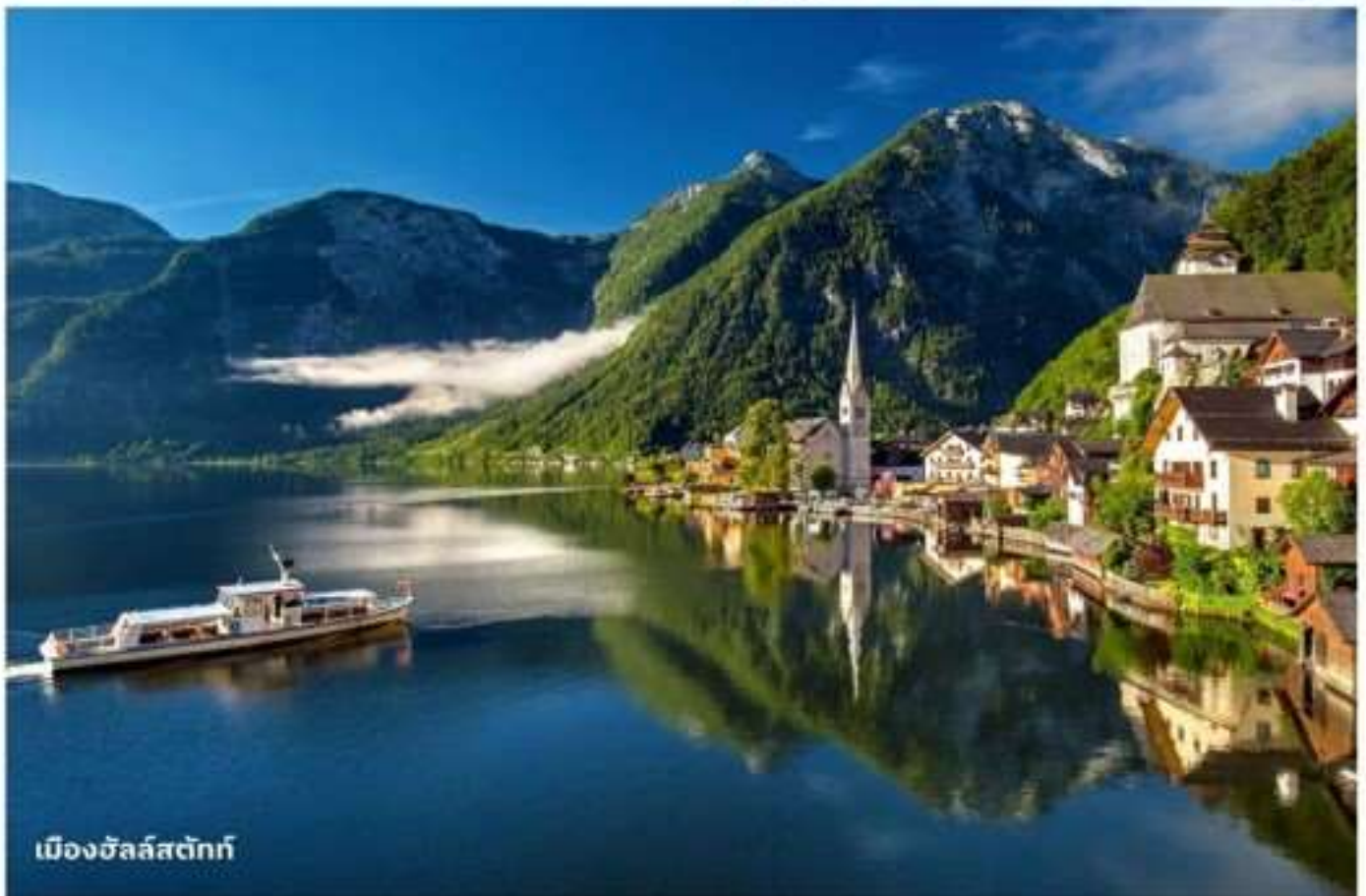
เมืองฮัลล์สตัดท์