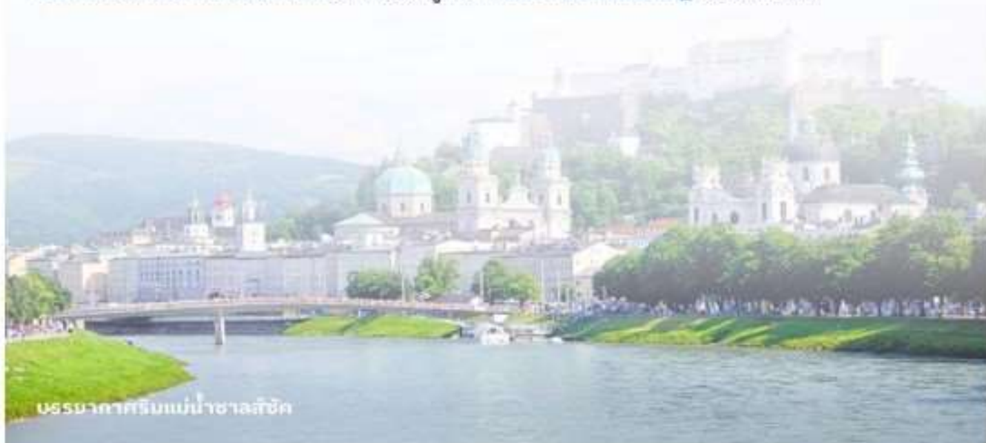
บรรยากาศริมแม่น้ำซาลส์บวร์ค

บริการอาหารค่ำ ณ กัตตาการ นำท่านเข้าสู่ที่พัก FourSide Salzburg หรือเทียบเท่า