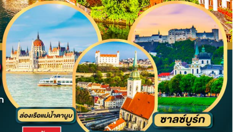
ส่องเรือแม่น้ำดานูบ