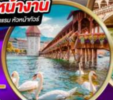
สะพานไม้ ซาเปลา