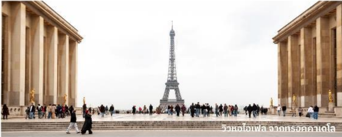
วิวหอไอเฟล จากหอออกเวลาเดลิส