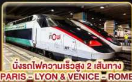
นั่งรถไฟความเร็วสูง 2 เส้นทาง PARIS - LYON & VENICE - ROME

📅 เดินทาง : 11-20 ก.พ. 68 / 15-24 มี.ค. 68 05-14 เม.ย. 68 / 29-08 พ.ค. 68