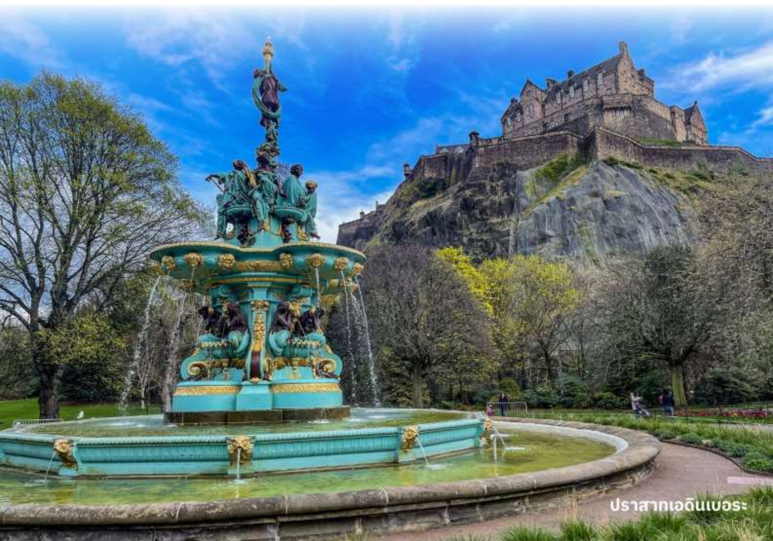
ปราสาทเอดินเบอระ

ผังตรงข้ามเป็นรัฐสภาแห่งชาติสกอตอันน่าทึ่งด้วยสถาปัตยกรรมร่วมสมัย