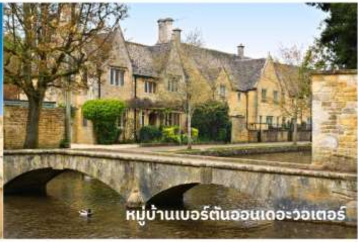
หมู่บ้านเบอร์ตันออนเดอะวอเตอร์