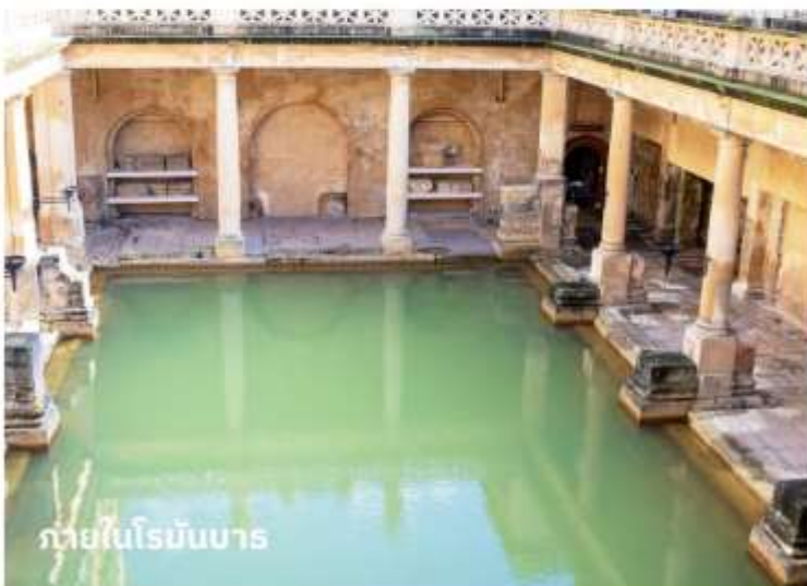
ภายในโรมันบาร