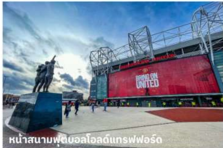
หน้าสนามฟุตบอลโอลด์แทรฟฟอร์ด