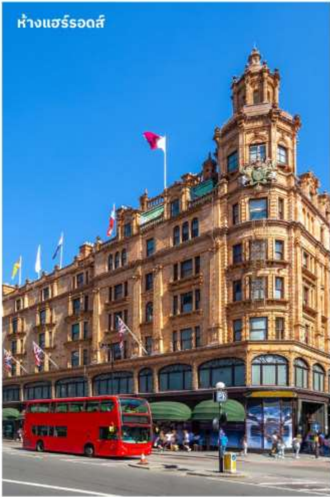
ห้างแฮร์รอดส์