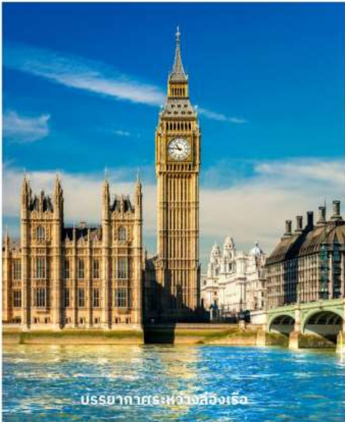
บรรยากาศระหว่างล่องเรือ

จากนั้นผ่านชมสถานที่สำคัญต่างๆ อาทิ บ้านเลขที่ 10, ถนนดาวนิงนี้่ทำเนียบนายกรัฐมนตรี, จัตุรัสทราฟัลการ์, อนุสรณ์แห่งสงครามทราฟัลการ์ของท่านลอร์ดแนลสัน, พิคคาเดิลลี เซอร์คัส, ย่านโซโฮ ฯลฯ