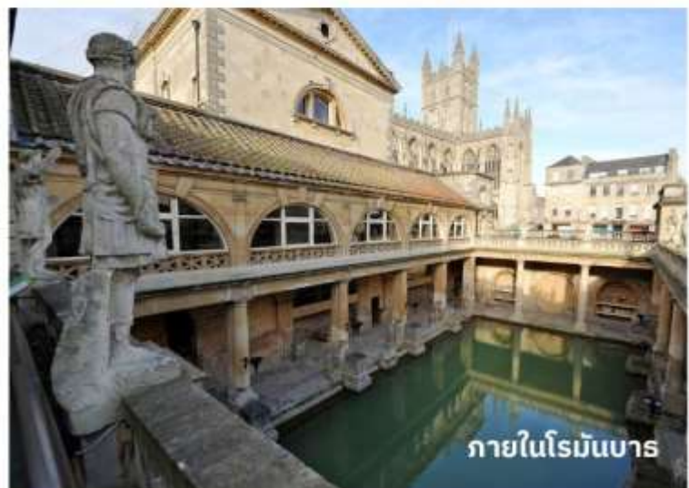
ภายในโรมันบาร