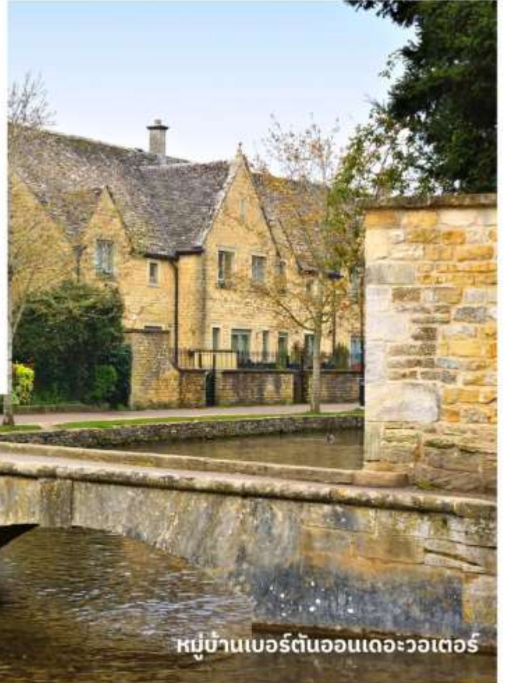
หมู่บ้านเบอร์ตันออนเดอะวอเตอร์

จากนั้นนำท่านเดินทางสู่ เขตคอตสวอลส์ เขตหมู่บ้านชนบทแสนสวยของอังกฤษถึง 70 หมู่บ้าน ใช้เวลาเดินทางประมาณ 3.30 ชั่วโมง นำท่านเที่ยวชม หมู่บ้านเบอร์ตันออนเดอะวอเตอร์ ( Bourton On The Water ) หมู่บ้านเล็ก ๆ ที่รู้จักกันในนามของ “เวนิส แห่งคอตวอลส์” เมืองที่โด่งดังที่สุดในคอตสวอลส์ ดูเจียบสงบมีลำธารสายเล็ก ๆ (แม่น้ำวินด์ริช) ไหลผ่านกลางเมือง และมีสะพานหินทอดข้ามน้ำเป็นช่วง ๆ กับต้นวิลโลว์ที่แกว่งกิ่งก้านใบอยู่ริมน้ำ