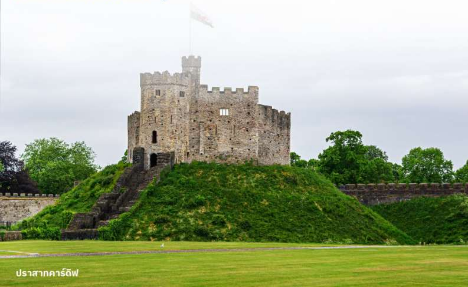
ปราสาทคาร์ดิฟฟ์

บริการอาหารค่ำ ณ ภัตตาคาร นำท่านเข้าสู่ที่พัก Hilton Garden Inn Bristol City หรือเทียบเท่า