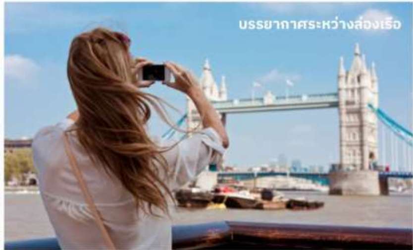
บรรยากาศระหว่างล่องเรือ

ชมทิวทัศน์งดงามของสองฝากฝั่งแม่น้ำเทมส์ ซึ่งไหลผ่านกลางกรุงลอนดอน ล่องเรือผ่านสถานที่สำคัญต่างๆ เช่น จัตุรัสรัฐสภา, พระราชวังเวสต์มินสเตอร์, ลอนดอนอาย, ทาวเวอร์ออฟลอนดอน และ ทาวเวอร์บริดจ์