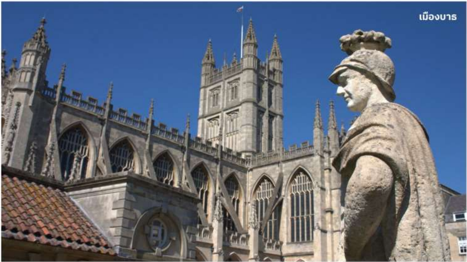
เมืองบาร

หลังจากนั้นนำท่านเดินทางสู่ เมืองบาร ดินแดนแห่งอาณาจักรโรมันอันยิ่งใหญ่บนเกาะอังกฤษเมื่อกว่า 2,000 ปีมาแล้ว ใช้เวลาเดินทางประมาณ 1.30 ชั่วโมง นำท่านเข้าชม โรงอาบน้ำแร่โรมัน ที่ชาวโรมันมาสร้างไว้เป็นสถานที่อาบน้ำแร่โดยอาศัยน้ำจากบ่อน้ำแร่ธรรมชาติที่จะมีน้ำไหลออกมาอย่างต่อเนื่องถึงวันละประมาณ 1,250,000 ลิตร และมีความร้อนถึง 46 องศาเซลเซียส ที่เมืองบารมี บ่อน้ำพุร้อนตามธรรมชาติ 3 แห่ง บ่อนที่ใหญ่ที่สุดคือที่ ROMAN SACRED SPRING น้ำพุจากใต้ดินลึก 3,000 เมตร มีแร่ธาตุถึงกว่า 43 ชนิด