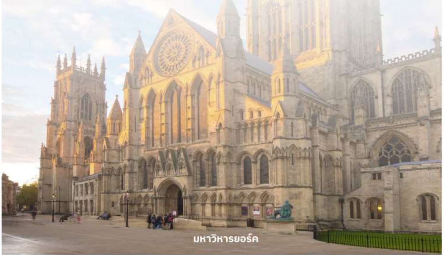
มหาวิหารยอร์ก

จากนั้นนำท่านเดินต่อไปที่ The Shambles (เดอะแชมเบิล) เป็นสถานที่ที่มีความคล้ายกับตรอกไดอากอนในภาพยนตร์ชื่อดังอย่าง Harry Potter อีสระให้ท่านเดินเลือกซื้อของที่ระลึกตามอัธยาศัย