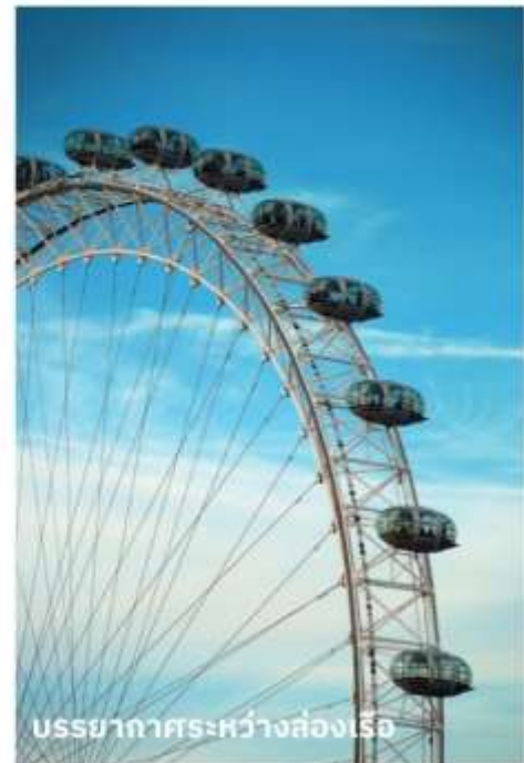
บรรยากาศระหว่างล่องเรือ

ท่านสามารถทำการสแกน QR CODE นี้ เพื่อรับชม “บรรยากาศของ Big Ben” ในรูปแบบวิดีโอ