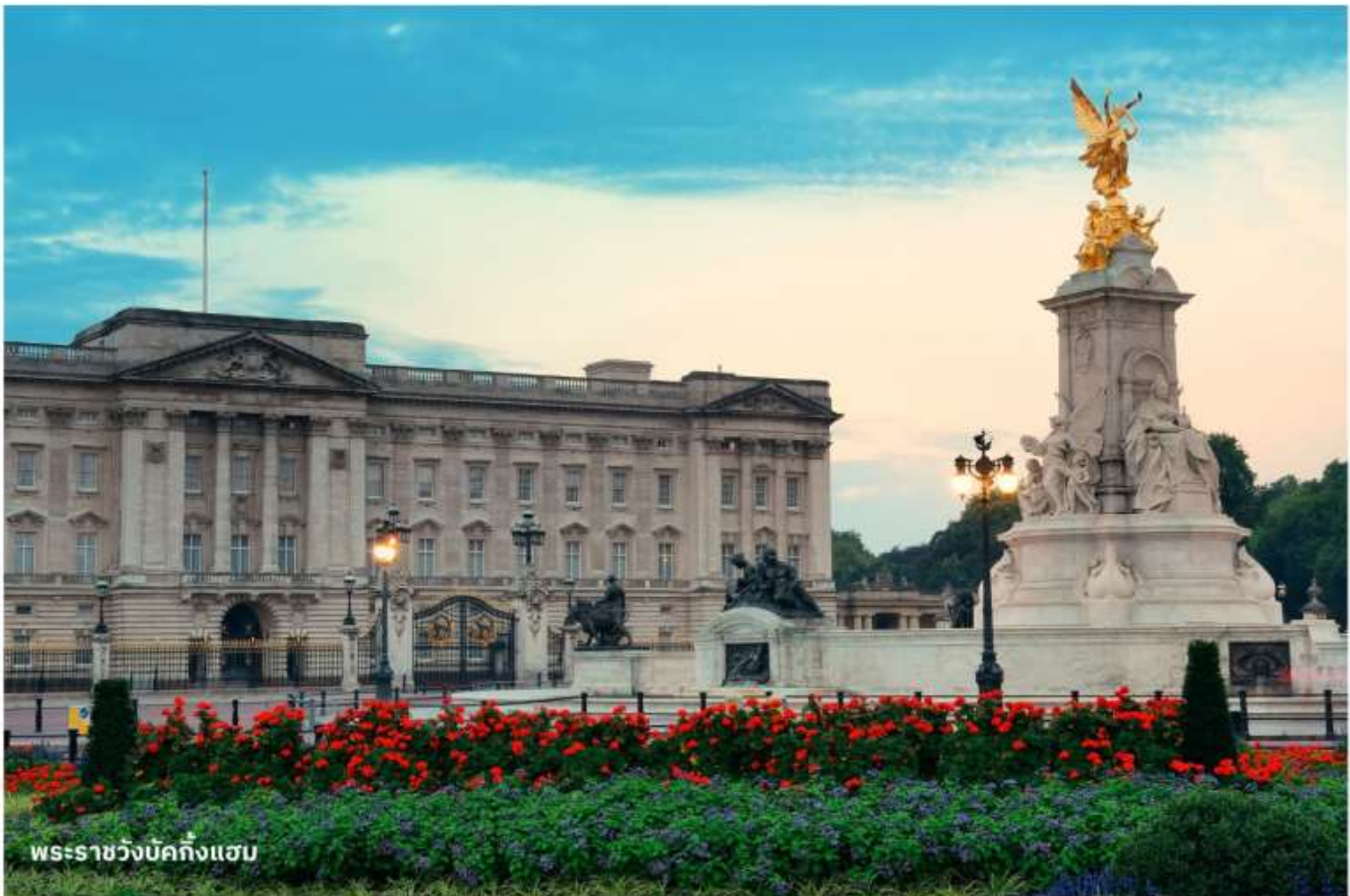
พระราชวังบักกิงแฮม

ได้เวลาอันสมควรนำท่านสู่สนามบิน เพื่อเตรียมตัวเดินทางกลับประเทศไทย