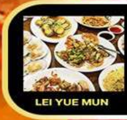
LEI YUE MUN