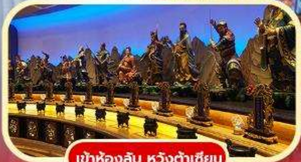
เข้าห้องลับ หวังต้าเซียน