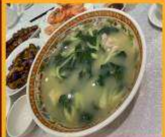
ซุปรังใส่หมู