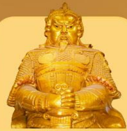
วัดแชกงหมิว