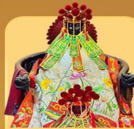
เจ้าแม่กวนอิมสองขำ