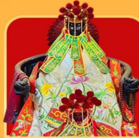
เจ้าแม่กวนอิมสองอำเภอ