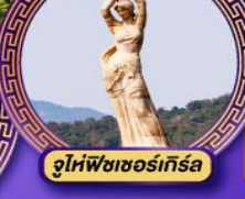
จูโห่พิชเชอร์เกิร์ล