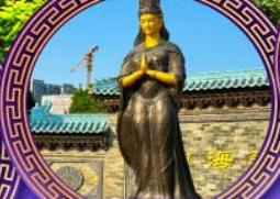
วัดเจ้าแม่ทับทิม