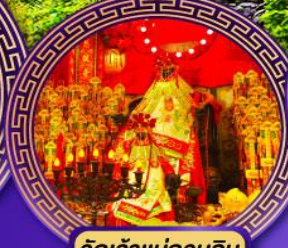
วัดเจ้าแม่กวนอิม ฮ่องฮ่า