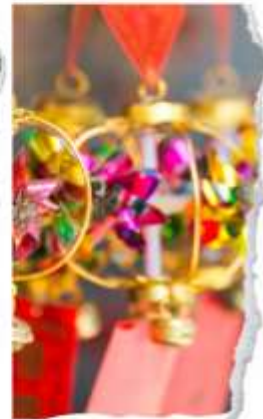
วัดแขกหมิว

นำท่านขอพรเพื่อเป็นสิริมงคล วัดแห่งนี้เป็นวัดที่คนฮ่องกงให้การเคารพนับถือเป็นอย่างมาก เป็นวัดเก่าแก่และมีชื่อเสียงที่สุดวัดหนึ่งของฮ่องกง เป็น 1 ในวัดของฮ่องกงที่ทุกท่านห้ามพลาดเลยก็เดียว