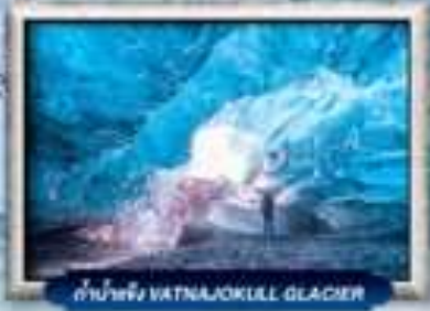
ดำน้ำแข็ง WATNAJOKULL GLACIER

บินทรู สายการบิน Full Service | พิเศษ! ทานอาหารโคตรจกั๋ว 360 องศา