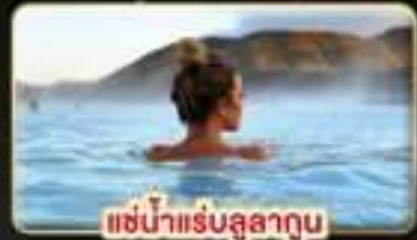
แช่น้ำแร่บลูลาทูน