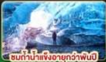
ชมถ้ำน้ำแข็งอายุกว่าพันปี