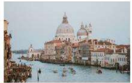
แกรนด์คาแนล

นำทุกท่านนั่งเรือต่อเพื่อไปยัง ท่าเรือซานมาร์โก (San Marco Pier) บนเกาะเวนิส แวะให้ท่านถ่ายรูปสวยๆ เก็บเป็นที่ระลึกกันที่ พระราชวังดอดจ์ พระราชวังริมน้ำแสนอลังการ ที่สร้างตั้งแต่ศตวรรษที่ 14 ในสไตล์เวเนเซียนโกธิค ที่เคยเป็นที่ประทับของผู้ปกครองของเวนิส แต่ตั้งแต่ปี 1923 ก็ได้เปลี่ยนเป็นพิพิธภัณฑ์ให้คนทั่วไปได้เข้าชม เป็นหนึ่งในแลนด์มาร์คหลักของเวนิส จากนั้นเดินเที่ยวชมแลนด์มาร์คสำคัญต่างๆ ในเมือง จัตุรัสเซนต์มาร์ค เป็นจัตุรัสหลักของเมืองเวนิส และยังเป็นศูนย์กลางเมืองตั้งแต่โบราณ จากนั้นนำท่านถ่ายรูปกับ มหาวิหารเซนต์มาร์ค มหาวิหารใหญ่ ของศาสนาคริสต์นิกายโรมันคาทอลิก อลังการด้วยการตกแต่งด้วยโดมใหญ่ และที่อยู่ติดกันและโดดเด่นด้วยความสูงถึง 50 เมตรก็คือ หอรบั้ง ถือเป็นหนึ่งในสัญลักษณ์ของเมืองที่ เห็นได้ไม่ว่าจะอยู่มุมไหนของเมืองก็ตาม และที่พลาดไม่ได้เลยก็คือ สะพานกอนหายใจ สะพานอันโด่งดังแห่งนี้ตั้งอยู่เหนือแม่น้ำที่คั่นกลางระหว่างคูเก่ากับพระราชวังดอดจ์