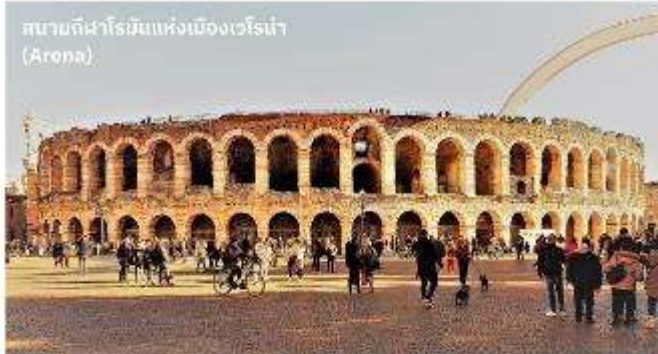
สนามกีฬาโรมันแห่งเมืองเวโรน่า (Arona)

บริการอาหารค่ำ ณ ภัตตาคาร นำท่านเข้าสู่ที่พัก Best Western Plus Hotel Expo หรือเทียบเท่า