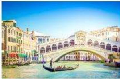
สะพานริอัลโต