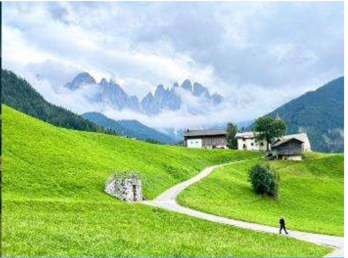
Santa Maddalena - Val di Funes