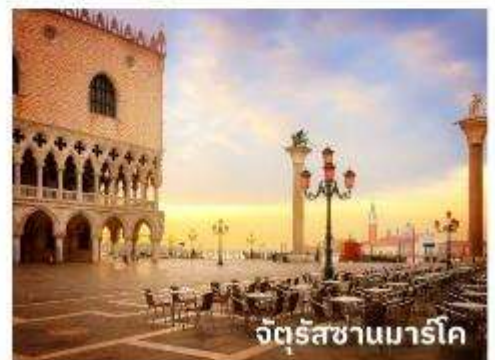
จัตุรัสซานมาร์โก

ท่านสามารถทำการสแกน QR CODE นี้ เพื่อรับชม เกาะเวนิส ในรูปแบบวีดีโอ