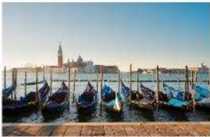
เรือกอนโดล่า

นำท่านออกเดินทางสู่ ท่าเรือตรอนเกตโต เพื่อเตรียมตัวนั่งเรือข้ามสู่เกาะเวนิส เกาะเวนิสเป็นดินแดนแสนโรแมนติก เป็นเมืองที่ไม่เหมือนใคร โดยใช้เรือแทนรถ ใช้คลองแทนถนน มีสมญานามว่าเป็น “ราชินีแห่งทะเลเอเดรียติก” มีเกาะน้อยใหญ่กว่า 118 เกาะและมีสะพานเชื่อมถึงกัน กว่า 400 แห่ง