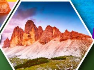
โตโลไมท์

โปรแกรมเดี่ยว เก็บครบจบ อิตาลี ตั้งแต่เหนือถึงใต้