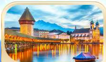
สะพานไมซ์าป