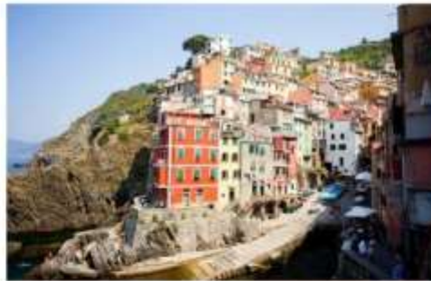
ซิงเคว เทเร