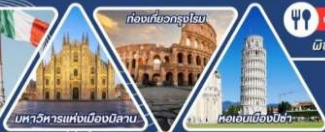
มหาวิหารแห่งเมืองมิลาน

นั่งรถไฟเที่ยวซิงเควเทอร์ เที่ยวเกาะเวนิส หอเอนพิซ่า ใน 7 สิ่งมหัศจรรย์