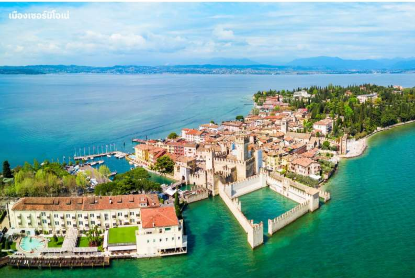
เมืองเซอร์มิโอเน่

บริการอาหารค่ำ ณ ภัตตาคาร นำท่านเข้าสู่ที่พัก IH Hotels Milano Lorenteggio หรือเทียบเท่า