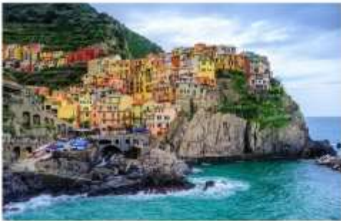
ซิงเคว เทเร

จากนั้นนำท่านเดินทางต่อด้วยรถไฟ สู่หมู่บ้านมรดกโลกและอุทยานแห่งชาติ ซิงเคว เทเร Cinque Terre อ่านว่า ซิงเควเทเร หรือแปลในความหมายตามภาษาอังกฤษก็คือ The Five Land แดนมหัศจรรย์ทั้ง 5 ที่ประกอบกันขึ้นมาเป็นดินแดนแห่งความงดงาม หมู่บ้านเล็กๆ 5 หมู่บ้านที่ซ่อนตัวอยู่ห่างไกลจากสายตาของคนภายนอก แผ่นดินที่ยากจะเข้าถึงได้โดยง่าย หมู่บ้านเล็กๆ 5 หมู่บ้านที่ตั้งเรียงอยู่มีห่างกัน