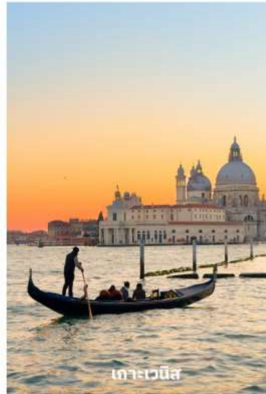
เกาะเวนิส

นำทุกท่านนั่งเรือต่อเพื่อไปยัง ท่าเรือซานมาร์โค (San Marco Pier) บนเกาะเวนิส แวะให้ท่านถ่ายรูปสวยๆ เก็บเป็นที่ระลึกกันที่ พระราชวังดอดจ์ พระราชวังริมน้ำแสนอลังการ ที่สร้างตั้งแต่ศตวรรษที่ 14 ในสไตล์เวเนเซียนโกธิค ที่เคยเป็นที่ประทับของผู้ปกครองของเวนิส แต่ตั้งแต่ปี 1923 ก็ได้เปลี่ยนเป็นพิพิธภัณฑ์ให้คนทั่วไปได้เข้าชม เป็นหนึ่งในแลนด์มาร์กหลักของเวนิส จากนั้นเดินเที่ยวชมแลนด์มาร์คสำคัญต่างๆ ในเมือง จัตุรัสเซนต์มาร์ค เป็นจัตุรัสหลักของเมืองเวนิส และยังเป็นศูนย์กลางเมืองตั้งแต่โบราณ จากนั้นนำท่านถ่ายรูปกับ มหาวิหารเซนต์มาร์ค มหาวิหาร ใหญ่ของศาสนาคริสต์นิกายโรมันคาทอลิก อลังการด้วยการตกแต่งด้วยโดมใหญ่ และที่อยู่ติดกันและโดดเด่นด้วยความสูงถึง 50 เมตรก็คือ หอรบขัง ถือเป็นหนึ่งในสัญลักษณ์ของ เมืองที่เห็นได้ไม่ว่าจะอยู่มุมไหนของเมืองก็ตาม และที่พลาดไม่ได้เลยก็คือ สะพานถอนหายใจ สะพานอันโด่งดังแห่งนี้ตั้งอยู่เหนือแม่น้ำที่คั่นกลางระหว่างคูกเก่ากับพระราชวังดอดจ์