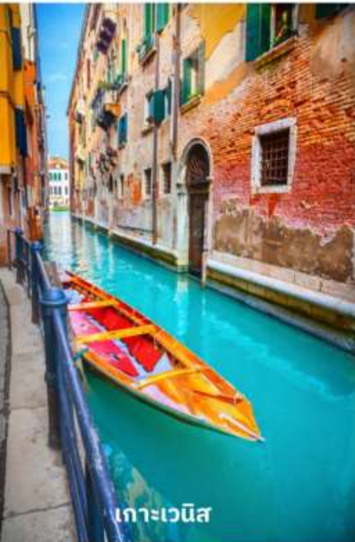
เกาะเวนิส

เพื่อเตรียมตัวนั่งเรือข้ามสู่เกาะเวนิส เกาะเวนิสเป็นดินแดนแสนโรแมนติก เป็นเมืองที่ไม่เหมือนใคร โดยใช้เรือแทนรถ ใช้คลองแทนถนน มีสมญานามว่าเป็น “ราชินีแห่งทะเลเอเดรียติก” มีเกาะน้อยใหญ่กว่า 118 เกาะและมีสะพานเชื่อมถึงกันกว่า 400 แห่ง