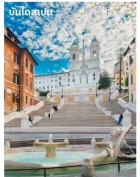
บันไดสเปน