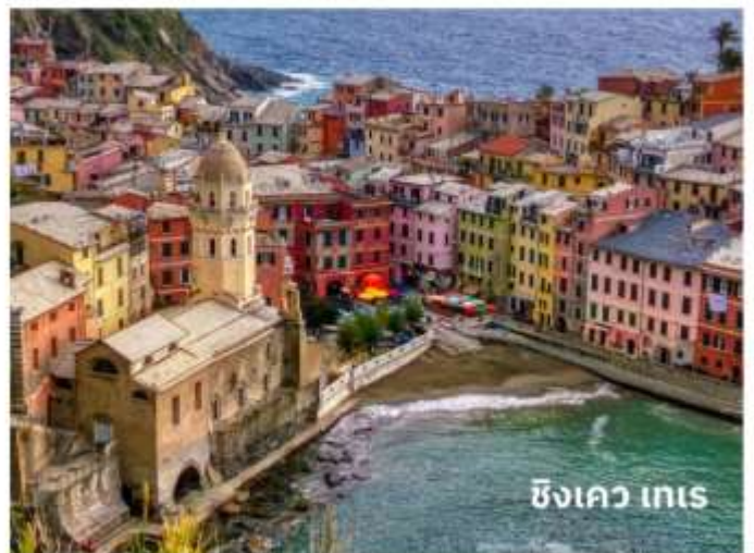
ซิงเคว เทเร

ท่านสามารถทำการสแกน QR CODE นี้ เพื่อรับชม “ซิงเควเทเร” ในรูปแบบวิดีโอ