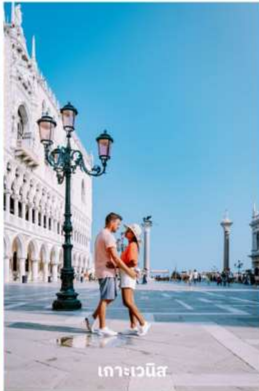
เกาะเวนิส