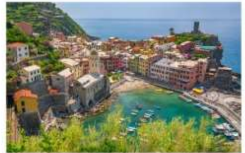
ซิงเคว เทเร

นำคณะเที่ยวชม ซิงเคว เทเร เป็นพื้นที่ที่ UNESCO ประกาศให้เป็นมรดกโลก ด้วยทำเลที่ตั้งของทั้งหมดอยู่บนภูเขาสูง โดมมีหน้าผาสูงชัน และทะเลกว้างใหญ่เป็นฉากหน้า ทำให้มีความสวยงามประดุจดั่งภาพวาด จึงเป็นอุปสรรคสำหรับผู้คนจากภายนอกในการที่จะเข้าไปให้ถึง แต่ในแง่ดีก็คือ หมู่บ้านทั้งห้ายังคงสภาพดั้งเดิมของมันมาได้ตั้งแต่ศตวรรษที่ 11 ประกอบไปด้วย Monterosso al Mare (มอนเตรอสโซ อัล มาเร), Vernazza (เวร์นาซซา), Corniglia (คอร์นีเลีย) , Manarola (มานาโรลา) และ Riomaggiore (ริโอมัจจอร์เร) **ทางบริษัทจะนำทุกท่านเที่ยวอย่างน้อย 1 จากใน 5 หมู่บ้าน**