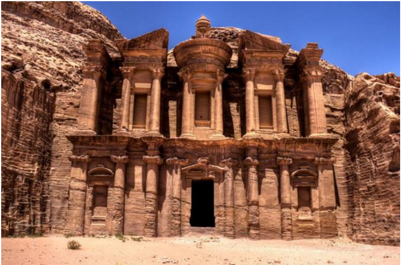
วันที่ห้า/ เมืองอคาบา – ลงเรือท่องกระajak – ทะเลทรายวาดีรัม เข้า/กลางวัน/เย็น

เช้า ☉ รับประทานอาหารเช้า ณ ห้องอาหารของ โรงแรม – และเช็กเอาท์ นำท่านเดินทางสู่เมือง เมืองอคาบา (Aqaba) เดินทางประมาณ 2 ชั่วโมง เมืองท่าและเมืองท่องเที่ยวตากอากาศที่สำคัญของประเทศจอร์แดน เป็นเมืองแห่งเดียวของประเทศจอร์แดนที่ถูกประกาศให้เป็นเมืองปลอดภาษี นำท่าน ลงเรือท่องกระajak (GLASS BOAT) แล่นในทะเลแดง ทะเลที่มีน่านน้ำครอบคลุมถึง 4 ประเทศ คือ ประเทศจอร์แดน, อิสราเอล, อียิปต์ และ ซาอุดีอาระเบีย ชมความใสของน้ำทะเล, ปะการัง, ปลาทะเลหลากชนิด ฯลฯ เที่ยง ☉ รับประทานอาหารบนเรือ บ่าย นำท่านเดินทางสู่ ทะเลทรายวาดีรัม (WADI RUM) ทะเลทรายแห่งนี้ในอดีตเป็นเส้นทางคาราวานจากประเทศซาอุดีอาระเบีย ไปยังประเทศซีเรียและปาเลสไตน์ ในศึกสงครามอาหรับบริโวลท์ระหว่างปี ค.ศ. 1916-1918 ทะเลทรายแห่งนี้ได้ถูกใช้เป็นฐานบัญชาการในการรบของนายทหารชาวอังกฤษ ทีอี ลอว์เรนซ์ และเจ้าชายไฟซาล ผู้นำแห่งชาวอาหรับร่วมกันขับไล่พวกออตโตมันที่เข้ามารุกรานเพื่อครอบครองดินแดน และต่อมาเป็นที่จริงในการถ่ายทำภาพยนตร์ฮอลลีวูดอันยิ่งใหญ่ในอดีตเรื่อง “LAWRENCE OF ARABIA” นำท่านนั่งรถกระบะเปิดหลังมารับบรรยากาศท้อง ทะเลทรายวาดีรัม ที่ถูกกล่าวขานว่าสวยงามที่สุดของโลกแห่งหนึ่ง ด้วยเม็ดทรายละเอียดสีส้มแดงอันเจียบสงบที่กว้างใหญ่ไพศาล ชมสถานที่ในอดีตนายทหาร ทีอี ลอว์เรนซ์ ทหารชาวอังกฤษใช้เป็นสถานที่พัก และคิดแผนการสู้รบกับพวกออตโตมัน นำท่านท่องทะเลทรายต่อไปยังภูเขาคาซารี ชมภาพเขียนแกะสลักก่อนประวัติศาสตร์ ที่เป็นภาพแกะสลักของชาวนาบาเทียนที่แสดง