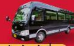
BUS (10-18 ท่าน)