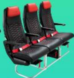
ที่นั่ง HOT SEAT