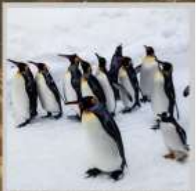
"PENGUIN ASAHİYAMA ZOO"