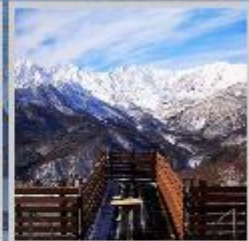
"HAKUBA MOUNTAIN HARBOR"