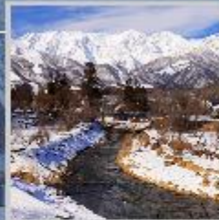
"HAKUBA OIDE PARK"