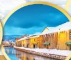
คลองโอตารุ