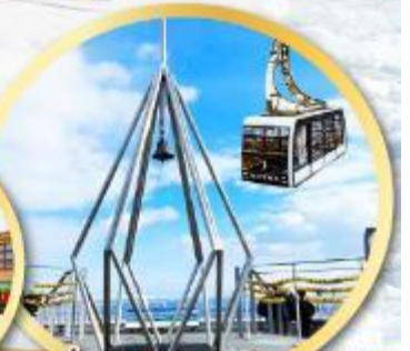
นั่งกระเช้าชมวิวเมืองซัปโปโร MT:MOIWA