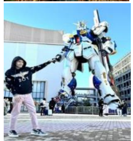
หุ่นกันดั้ม ชื่อ RX93 FF Nu Gundam

เดินทางต่อไปยัง ร้านค้า DUTY FREE ให้ท่านได้ช้อปปิ้งสินค้าปลอดภาษีที่มีคุณภาพ อาทิ เครื่องสำอาง โฟมล้างหน้า(แนะนำ) อาหารเสริม ขนม เครื่องใช้ต่างๆ ฯลฯ ...จากนั้นแวะ แชะรูปกับหุ่นกันดั้มยักษ์ ณ ห้าง LaLaport (หากมีเวลาพอ) มีขนาดใหญ่กว่า Unicorn Gundam ที่โตเกียวและใหญ่กว่า RX93 FF Gundam ที่ Gundam Factory Yokohama เรียกได้ว่าเป็นแลนด์มาร์คสำคัญของเมืองฟูกูโอกะในปัจจุบัน ...จากนั้นอิสระให้ท่านช้อปปิ้ง ย่านเทนจิน (Tenjin) หรือ ย่านฮากาตะ (Hakata) เป็นย่านช้อปปิ้งขนาดใหญ่ใจกลางเมือง รวบรวมแหล่งบันเทิง อย่างครบครัน ไม่ว่าจะเป็นตึกต้นไม้ ร้านค้าที่น่าสนใจ และบรรยากาศสุดคลาสสิก หรือจะเป็นย่านของกินอร่อยๆ อย่างย่านยะไต (Yatai) หมายถึง ชุมชนอาหารที่มีขนาดไม่ใหญ่มาก ที่รวมร้านอาหารแบบฉบับท้องถิ่นเอาไว้มากมาย