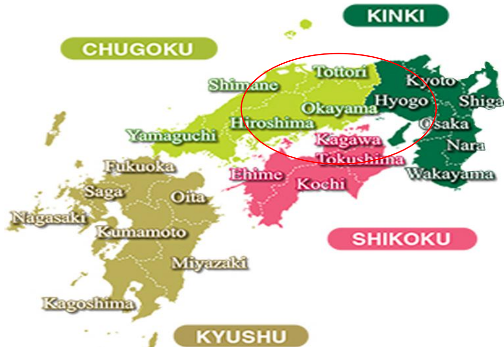
จังหวัด คางาวะ (KAGAWA) ตั้งอยู่บนเกาะชิโกกุ (SHIKOKU) 1 ใน 4 เกาะหลักของญี่ปุ่น