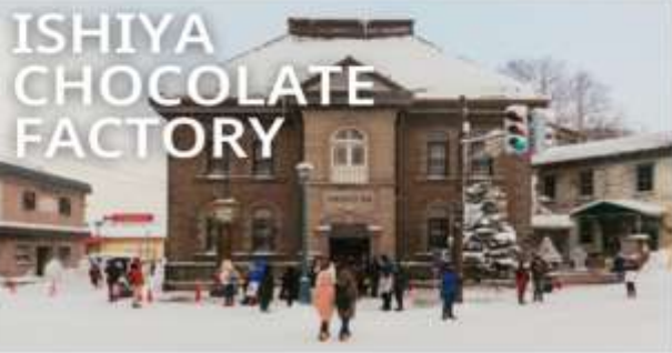
ISHIYA CHOCOLATE FACTORY