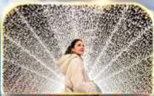
ชมงานประดับไฟนาฮานา ในะ ซาโตะ