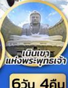
เนินเขา แห่งพระพุทธรเจ้า

ชมความน่ารักของสัตว์ต่างๆ ที่พิพิธภัณฑ์สัตว์น้ำโอตารุ