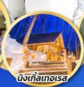
นิงเกิ้ลเทอเรส