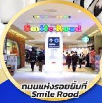
ถนนแห่งรอยยิ้มที่ Smile Road