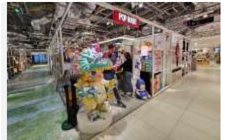
POP MART สายจุ่มถูกใจสิ่งนี้ !