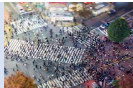
ย่านชิบูย่า – แหล่งรวมวัยรุ่น แฟชั่น

ทะเลสาบคาวากูจิโกะ ในฤดูหนาวที่นี้คือสวรรค์ที่งดงามสำหรับผู้หลงใหลในความเงียบสงบและความงามของธรรมชาติ เมื่อหิมะปกคลุมภูเขาไฟฟูจิและพื้นที่โดยรอบ ทิวทัศน์ที่นี้จะเปลี่ยนเป็นภาพที่งดงามราวกับบอออกมาจากภาพวาด หน้าหนาวที่นี้เต็มไปด้วยบรรยากาศที่โรแมนติก จากนั้น...นำพาทุกท่านสู่ DUTY FREE ที่ให้ทุกท่านได้เลือกซื้อหรือจะเลือกซื้อเป็นของฝากได้ตามอัธยาศัย โดยสินค้าที่แนะนำ เช่น วิตามินบำรุงสุขภาพ สรรพคุณหลากหลายชนิด และสินค้าชื่อดังของญี่ปุ่น โคมไฟตั้งโต๊ะหินภูเขาไฟ และ เครื่องสำอางค์ Special Set และอื่นๆ อีกมากมาย จากนั้นขอพาทุกท่านเข้าสู่..กรุงโตเกียว แวะกันที่ ย่านชิบูย่า (SHIBUYA) หนึ่งในจุดหมายที่ห้ามพลาดสำหรับผู้รักแฟชั่นและการช้อปปิ้งชั้นนำไม่เพียงแต่เป็นที่รู้จักจาก "ห้าแยกชิบูย่า" ที่มีชื่อเสียง ที่นี่ยังมีร้าน POP MART ที่เอาใจสายจุ่มอีกด้วย นอกจากนี้ยังมีร้านค้าหรูและร้านแฟชั่นที่ทันสมัยมากมาย เช่น SHIBUYA 109 และ PARCO รวมไปถึงคาเฟ่ และร้านอาหารที่น่าสนใจอีกมากมายที่คุณสามารถแวะไปพักผ่อนระหว่างการช้อปปิ้ง และให้ทุกท่านได้เพลิดเพลิน เรา อีสาระอาหารเย็น เพื่อให้ทุกท่านได้เลือกรับประทานอาหารได้ตามอัธยาศัย