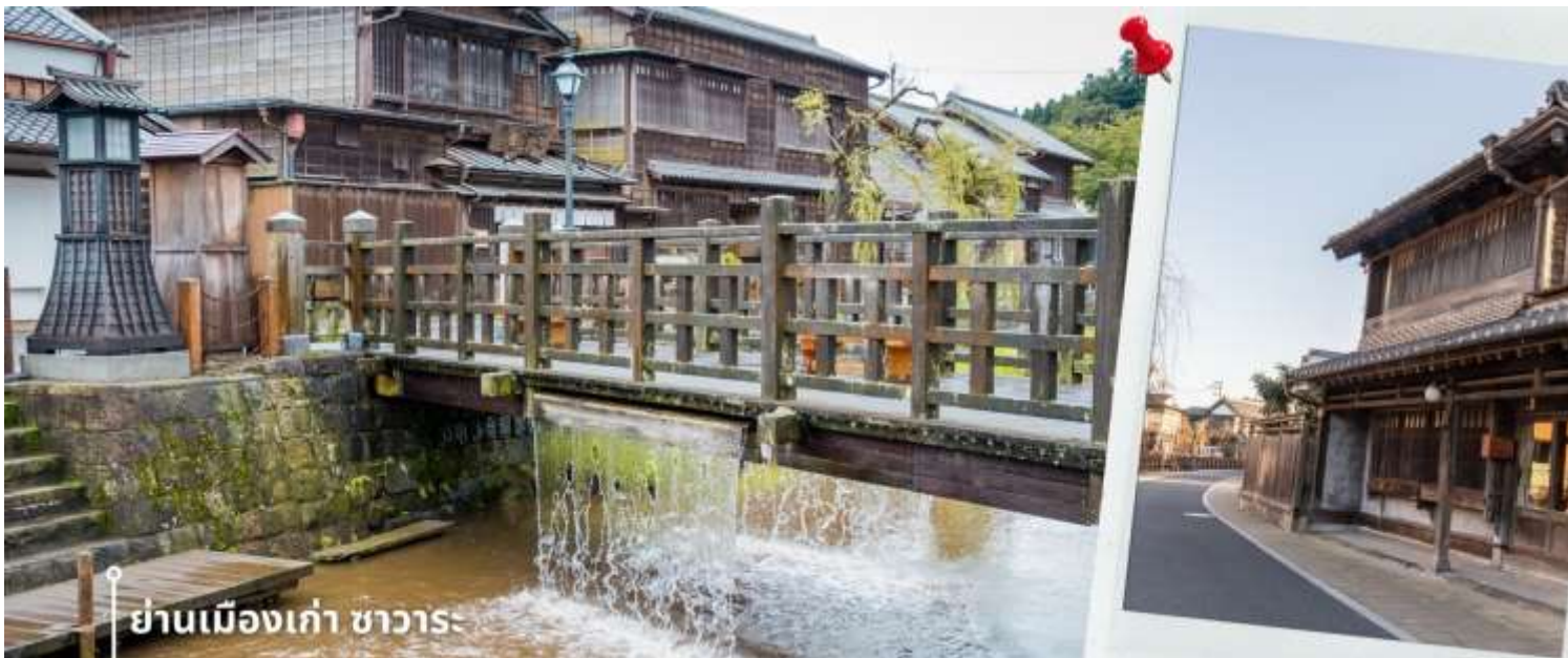
ย่านเมืองเก่า ซาวาระ

หลังรับประทานอาหารเที่ยง นำท่านเดินทางสู่ ย่านเมืองเก่าซาวาระ Sawara Old Town เป็นเมืองเล็กๆ อยู่ไม่ไกลจากโตเกียวหรือที่รู้จักในอีกชื่อว่า โคเอโดะ หรือ เอโดะน้อย เป็นย่านที่ให้ท่านได้สัมผัสกับบรรยากาศยุคเอโดะของญี่ปุ่น (ค.ศ. 1603 - ค.ศ. 1867) บรรยากาศเมืองเก่าที่เต็มไปด้วยกลิ่นอายสมัยเอโดะที่ยังคงความดั้งเดิมไว้อย่างดี ทั้งสถาปัตยกรรม ตึกที่ยังคงความเก่าราวกับย้อนยุค วิถีชีวิตชาวบ้านที่ยังคงเอกลักษณ์เฉพาะตัว งานฝีมือแบบดั้งเดิม และประวัติศาสตร์ความเป็นอยู่ของพื้นที่ ไฮไลท์อีกหนึ่งสิ่งที่ไม่ควรพลาดของซาวาระคือ สะพานจจาจา (Ja Ja Bridge) สะพานที่มีน้ำไหลออกมาจากทั้งสองด้านเหมือนน้ำตก เป็นเอกลักษณ์ที่โดดเด่น ให้ท่านได้อิสระเดินชมบรรยากาศและเก็บภาพความประทับใจ